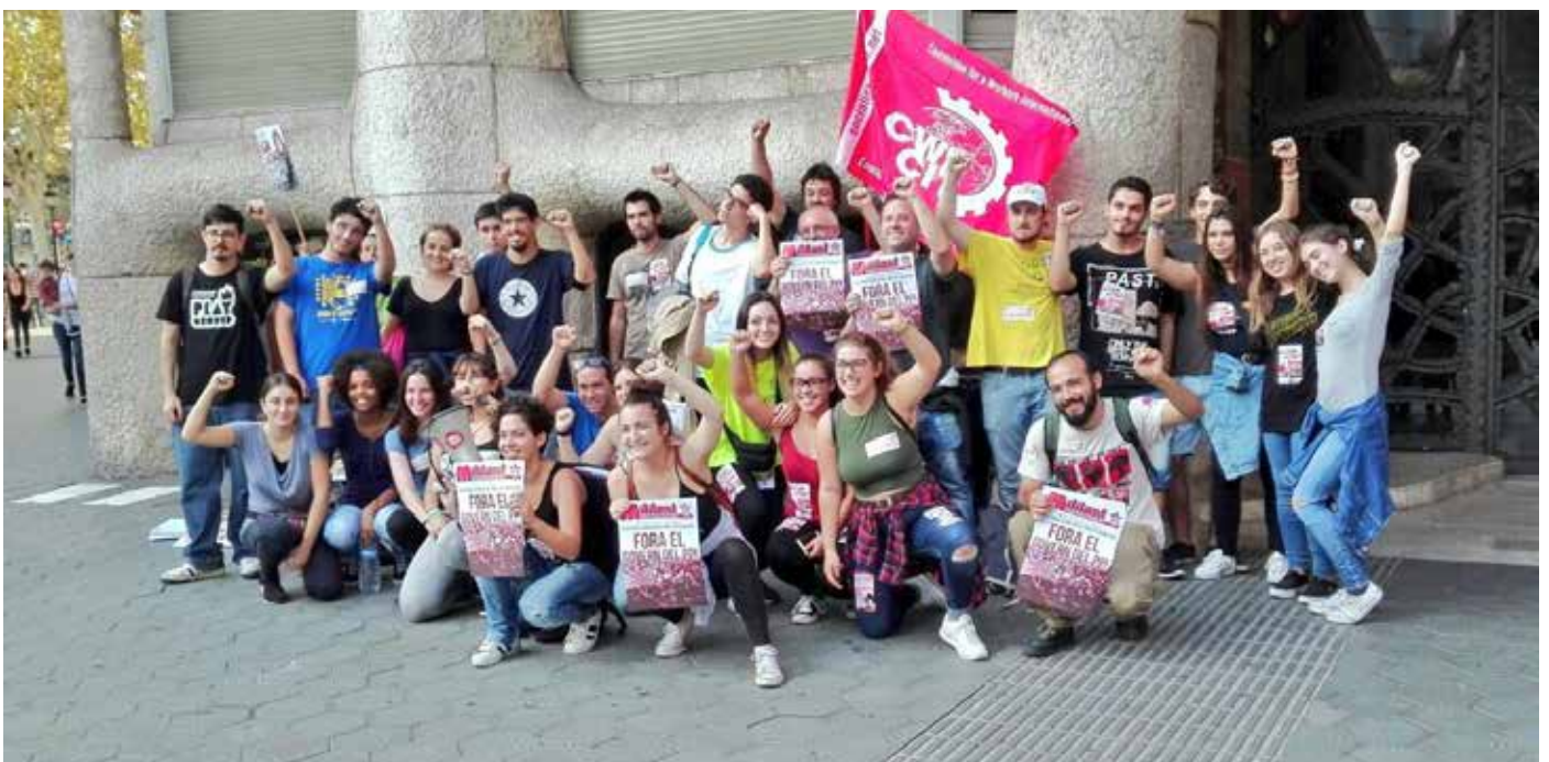
Leden van Izquierda Revolucionaria op een betoging. IR (Spanje) maakt net als Socialistisch Alternatief in Nederland deel uit van het Comité voor een Arbeidersinternationale

Ben je ook geïnteresseerd om lid te worden of wil je meer informatie? Bezoek onze websites: socialistischalternatief.nl en www.socialistworld.net , of stuur een email naar: info@socialisten.net