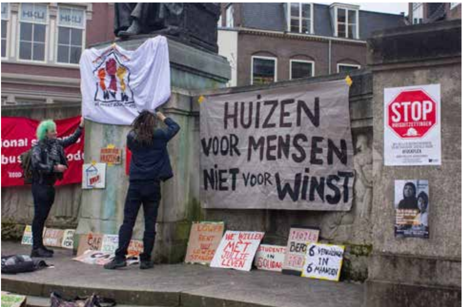
Actie 'We want woonruimte' in Utrecht

Met de invoering van het “sociaal” leenstelsel in 2015 is de toegankelijkheid van het hoger onderwijs nog verder onder druk komen te staan. De basisbeurs is afgeschaft, als je ouders een laag inkomen hebben is het nog wel mogelijk een aanvullende beurs te krijgen van maximaal 378 euro. Maar dit is nog niet eens genoeg om je huur van te betalen, laat staan je eten, ziektekosten, collegegeld, boeken.... Alle studenten moeten dus forse bedragen gaan lenen. Voor de invoering van het leenstelsel was de gemiddelde studieschuld al 20.000 euro. Dit schrikt natuurlijk vooral kinderen uit de arbeidersklasse af. Het aantal kinderen van laagopgeleide ouders dat naar het hoger onderwijs ging daalde dan ook na de invoering van het leenstelsel met 15%. Als doekje voor het bloeden is het collegegeld voor het eerste jaar gehalveerd, maar daarna is het nog steeds 2060 euro. Sinds de jaren zeventig is het collegegeld maar liefst